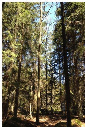
Figur 5. Intensiv ekskötsel i gran-ek-blandbestånd av Erik Ståål i Blekinge. Foto: Andreas Mölder.