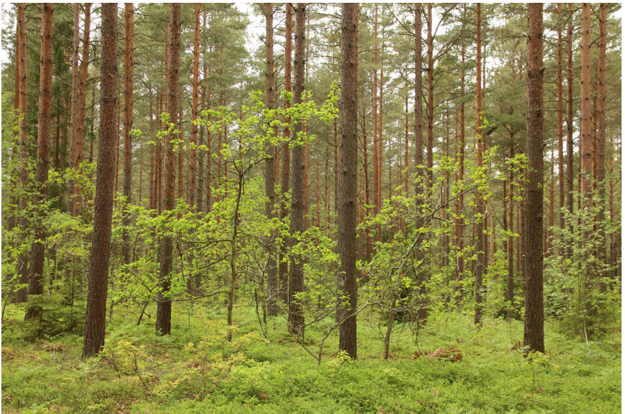
Figur 1. Spontanforyngnad ek i en tallskog kan utgöra basen till ett ekskogsbruk i blandskog. Här kan nog för yngningen skyllas på nötskrikan. Värnsnäs, Kalmar.

Ollonförekomsten kring enskilda ekar påverkas mycket av fåglar och däggdjur. Gnagare kan äta upp frön men dessutom sprida ollon upp till 30 meter i beståndet.