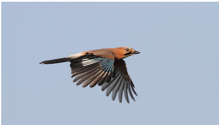
Figur 2. Nötskrikan är en fenomenal spridare av ekollon. Den väljer de tyngsta och bästa ollonen och myllar ner dem på perfekt gröningsdjup. I tyska studier har man sett att nötskrikan flyger 13 gånger per timme med i genomsnitt 3 ollon per tur.

Nötskrikan (figur 2) är dock en mycket mer effektiv fröspridare. Fågeln samlar ollon och myllar ner dem på 1-4 centimeters djup, mellan mineraljord och humus. Det ger alltså perfekta förutsättningar för groning. Nötskrikan väljer dessutom ofta ut de tyngsta och bästa ekollonen.