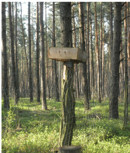
Figur 3. En trälåda cirka 2 meter över markytan fylls med ekollon. Nötskrikan hjälper till att sprida dem.

man god erfarenhet av metoden. Nötskrikan använder lådan som en matbutik där den hämtar ollon och gömmer i marken